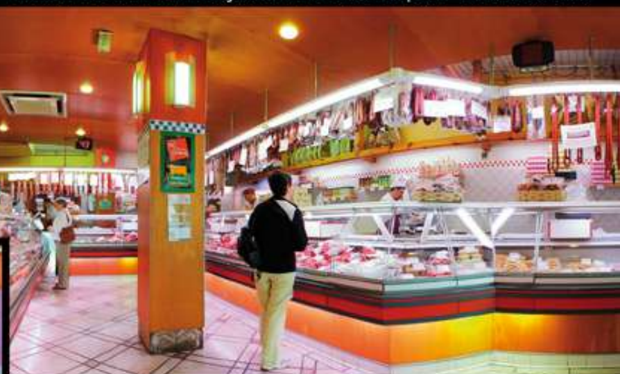
Carnicería BOSCO II. C. Monasterio Irache · 31011 Pamplona · Tel. 948 275 552