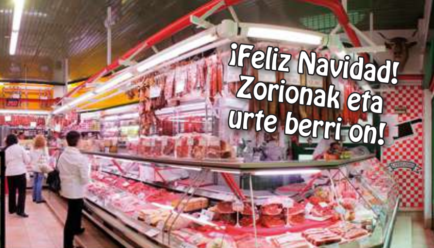
Carnicería FERNANDEZ. Pasaje Zakartín · 31001 Pamplona · Tel. 948 224 962

¡Feliz Navidad! Zorionak eta urte berri on!